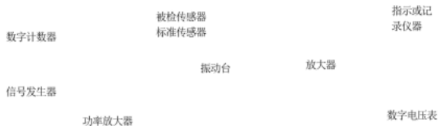
图 1 校准原理框图