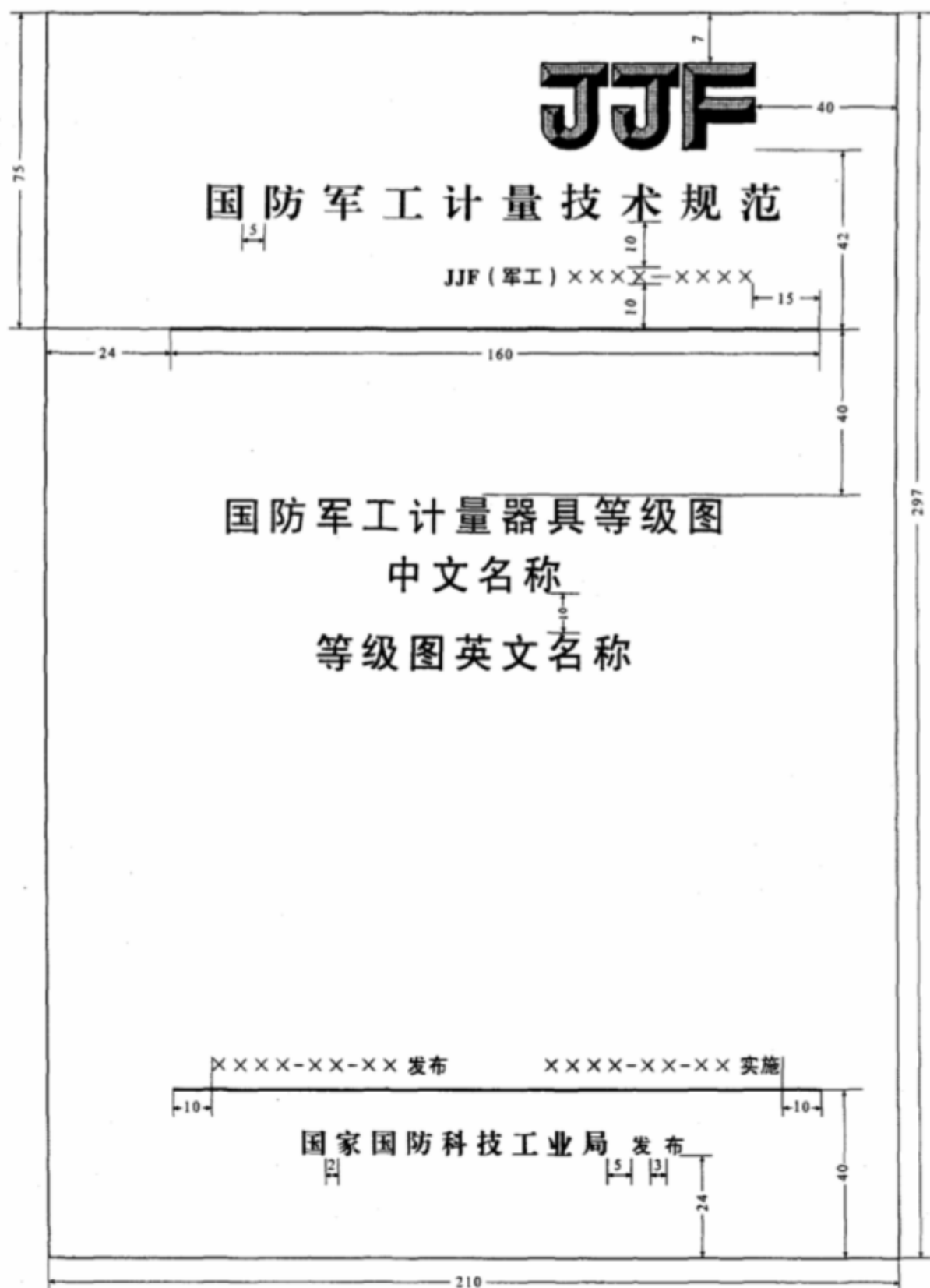
图 B.1 封面格式