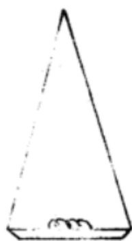
图 1 m_0 称量

4.2 测量装置如图 1~图 3。悬挂用的吊丝不吸水，直径不大于 0.25 mm。