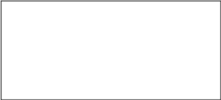
图 1 喷水口尺寸

5.3.7.8 用于家用和类似用途的风冷热泵机组和水热源热泵机组的电器安全性能应按照 GB 4706.32 规定的方法进行试验，应符合 4.9.8 的规定。