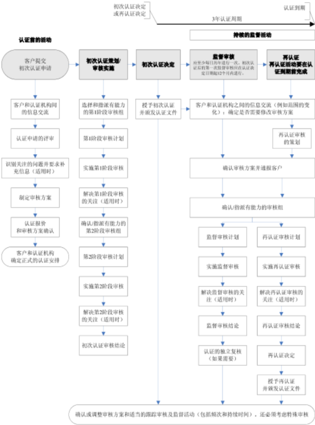
图 E.1——审核和认证过程的典型流程

图E.1代表了一个典型的流程。可以实施其他审核活动，例如文件审查和特殊审核。审核周期与认证周期之间的不同参见9.2和9.3。