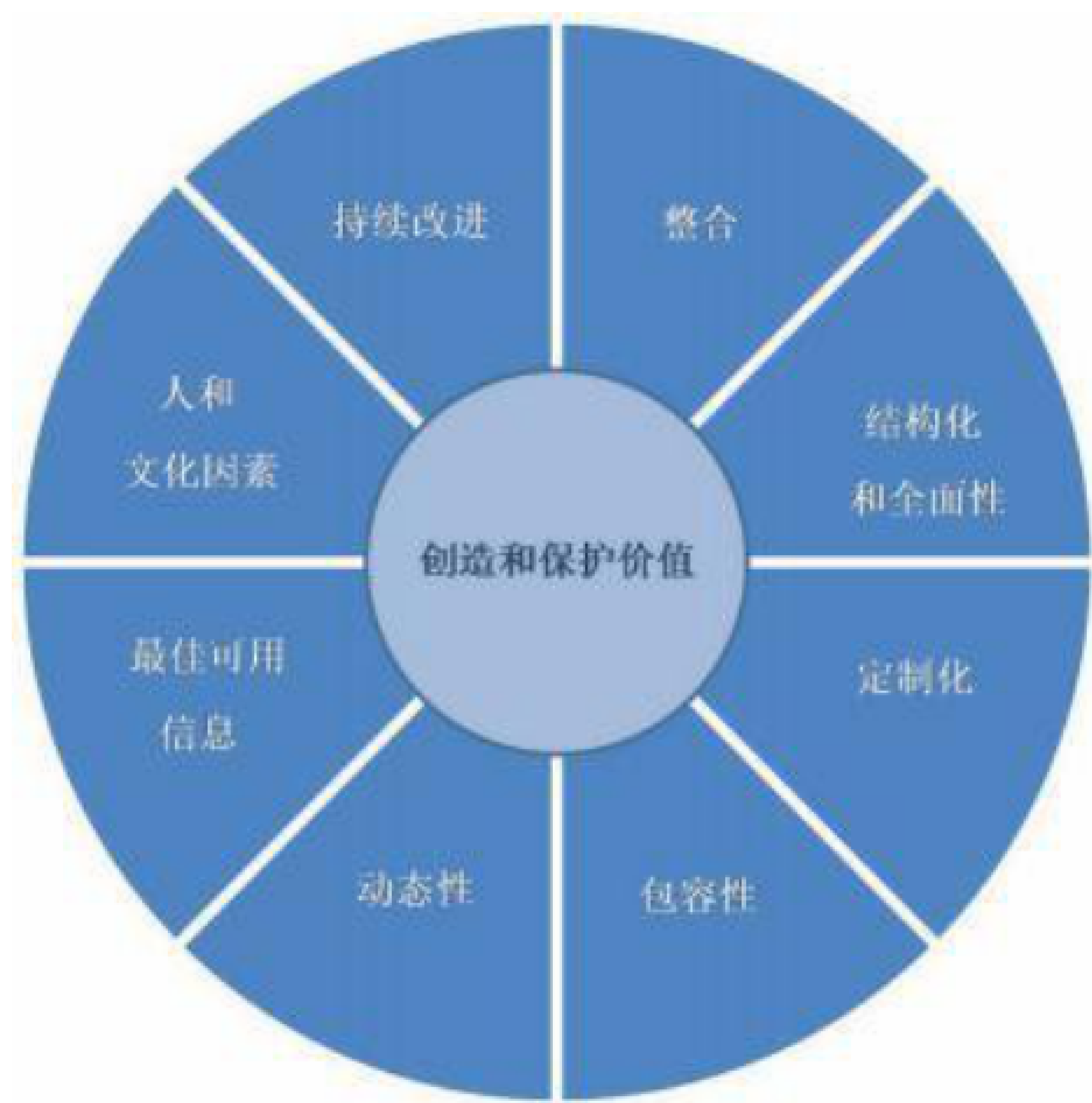
图 1 原则

以上风险管理的八项原则在法律风险管理环境下体现为 a) ~h) 所列示的内容。此外,进行法律风险管理,还需考虑“公平”原则,见i)。