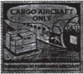
仅限货机标签 (2013年1月1日起强制使用)