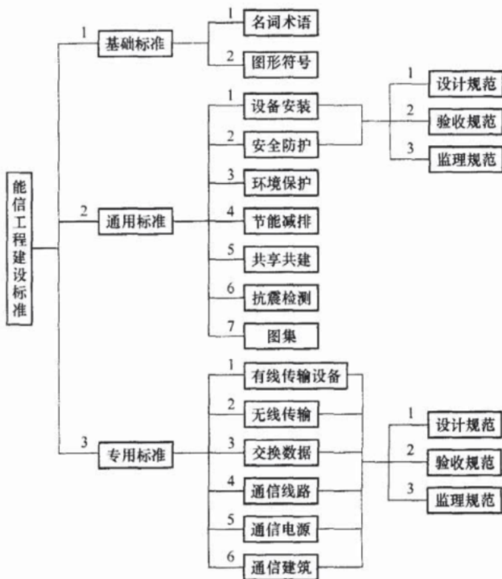
图 3.1.1 通信工程建设标准体系结构示意图