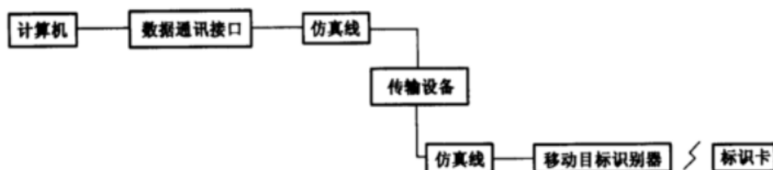
图 2 试验连接方式二