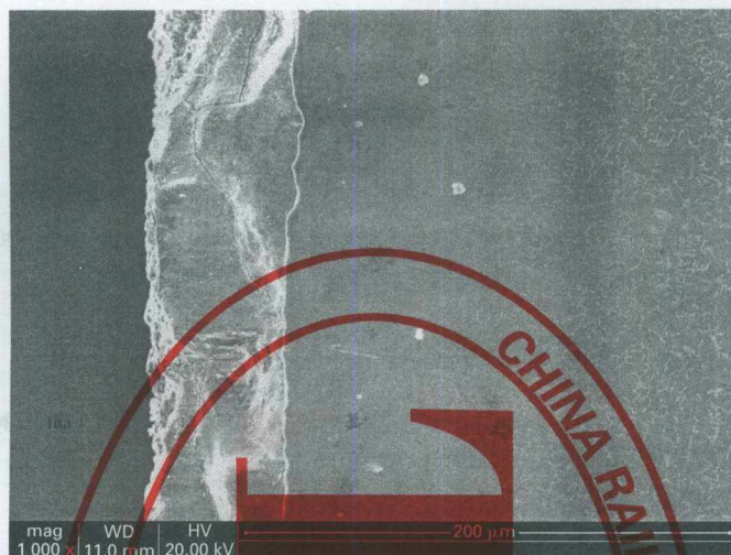
图 1 多元合金共渗层断面扫描电镜图片

至少有一点应含有 Zn、Al、La、Fe 等元素。断面电镜图片和基本谱图分别见图 1、图 2。