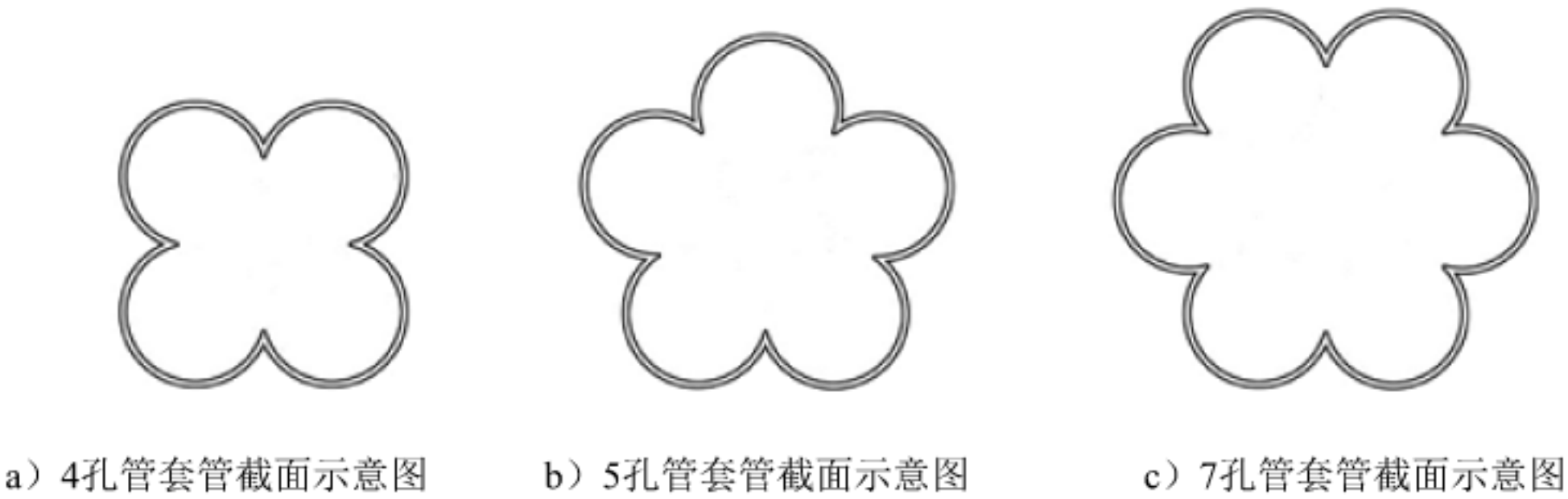
图2 套管截面示意图