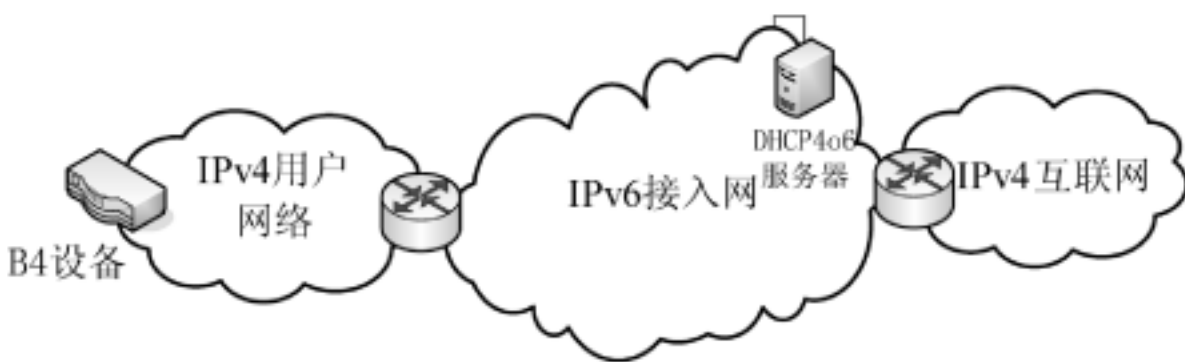
图 1 应用场景示意

应用场景如图 1 所示，IPv4 用户需要穿越 IPv6 网络实现和 IPv4 网络的组播业务互访。