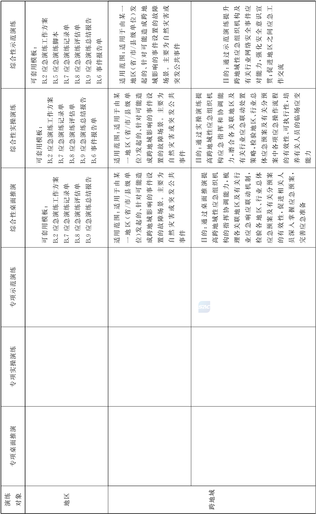
表 A.1 (续)