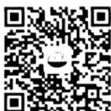
电力标准信息微信