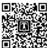
中国电力出版社官方微信