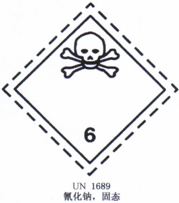
图 1 包装运输警示标签样式

在产品运输包装的醒目位置,应加贴、拴挂或喷印符合《关于危险货物运输的建议书 规章范本》(UN RTDG)的包装运输警示标签,样式如图 1 所示。