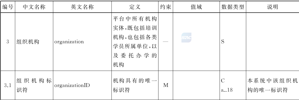
表 4 组织机构基本属性

组织机构信息的基本属性包括了组织机构标识符、组织机构名称、组织机构简称、上级组织机构标识符、统一社会信用代码。组织机构基本属性应符合表 4 的规定。