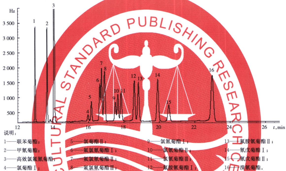
图 B.1 9 种菊酯类农药标准物质气相色谱图