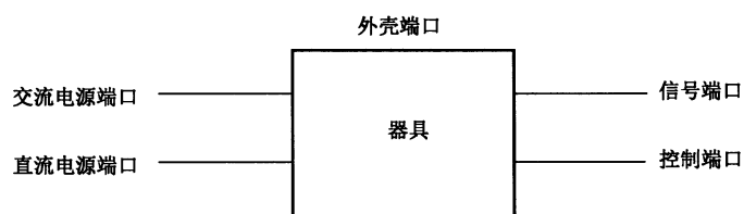
图 1 端口示例