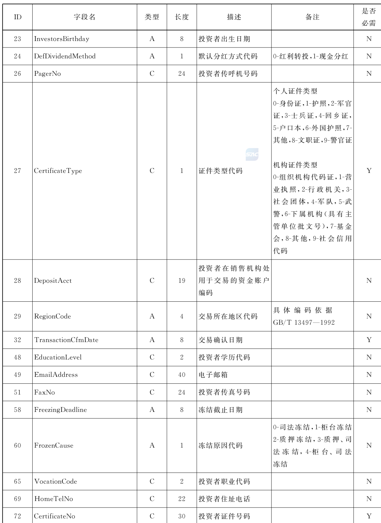
表 42 账户信息通知 (续)