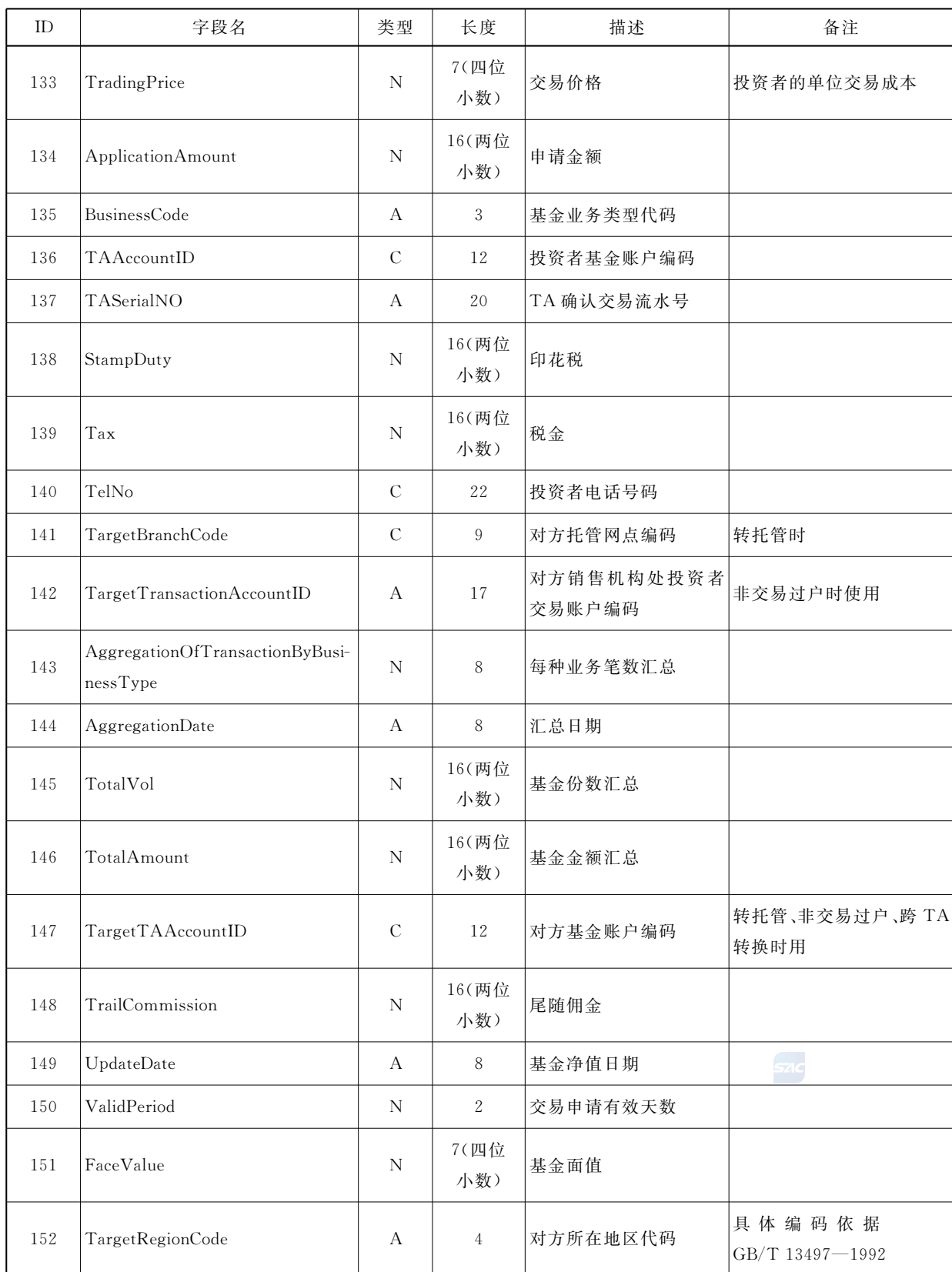
表 B.1 数据字典(续)