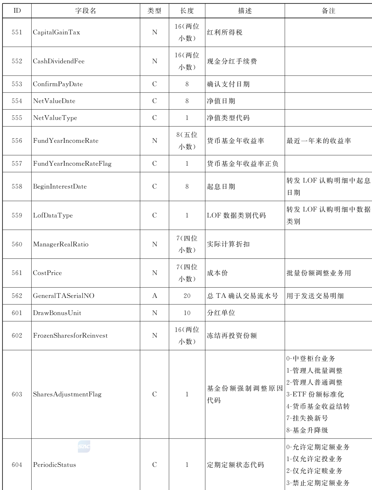
表 B.1 数据字典(续)