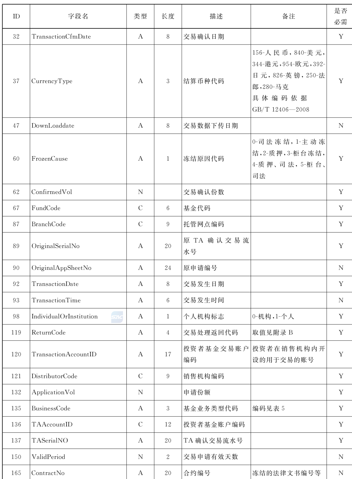
表 28 份额解冻业务确认数据（续）