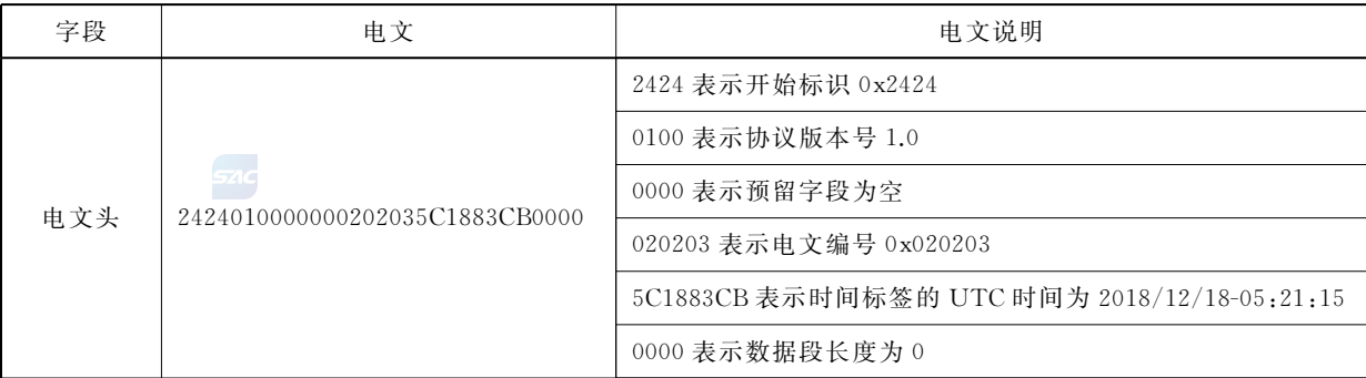
表 A.23 卫星高度截止角获取电文示例说明