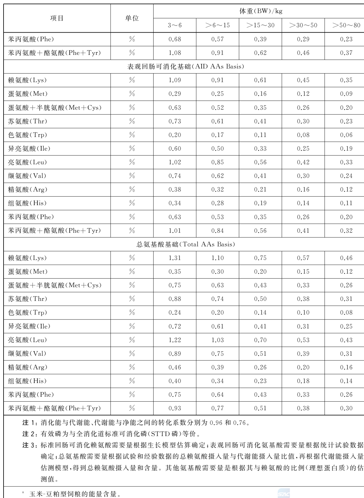
表 27 (续)