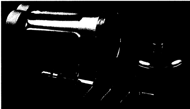
图 1 搅拌浆杯及多叶片浆叶总成

用于实验室中常压下制备泡沫水泥浆的搅拌浆杯见图 1。 搅拌浆杯与制备常规水泥浆的浆杯相似,不同之处在于它的杯盖带有丝扣和 O 型密封圈。杯盖的中心位置有一个直径为 19 mm 的圆孔,配有带排气孔可拆卸的密封塞。传统的搅拌浆杯没有密封设计,不能用于泡沫水泥浆制备。