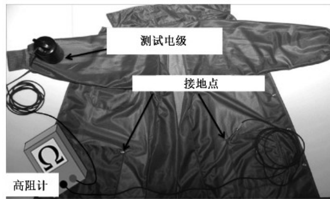
图 A.1 具有接地点的防静电服点对点电阻测试示意图