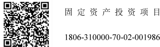
图 2 项目代码标识示例