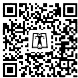
中国电力出版社官方微信